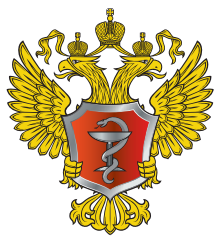
Министерство здравоохранения РФ

Уважаемые родители, здоровье каждого ребенка бесценно! Не растерявшись в экстренной ситуации и правильно оказав первую помощь, вы спасете ребенку жизнь!